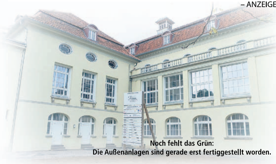
Noch fehlt das Grün: Die Außenanlagen sind gerade erst fertiggestellt worden.

Das Veranstaltungszentrum im Herzen Schaumburgs