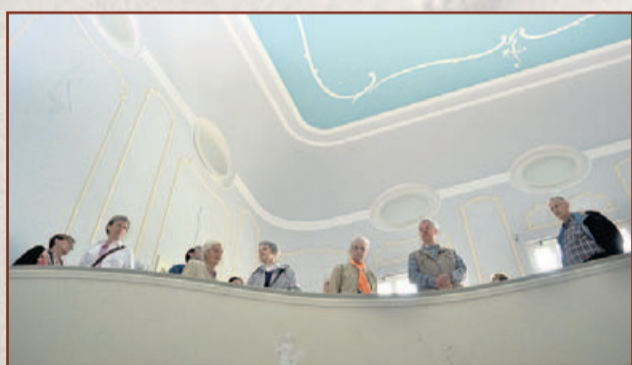
Runde Formen, harmonische Farben: die Galerie im Julianensaal.

Zu guter Letzt möchte Noçon ein weiteres Spielbein in Bewegung setzen: Gleichsam als „Allrounder“ könne das Organisationsteam des Hauses daran interessierten Kunden durchorganisierte, auf den jeweiligen Geschmack ausgerichtete und ausgearbeitete Veranstaltungen als Komplettpaket anbieten – gewissermaßen als Rundum-Sorglos-Event. Wie zu hören ist, gibt es längst erste Anfragen, obschon das Objekt ja bislang bestenfalls Planskizze – oder eben als Baustelle – zu besichtigen war. Unsere Zeitung jedenfalls wünscht: Bestes Gelingen!