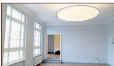
Gut für private Feiern: die Lounge.