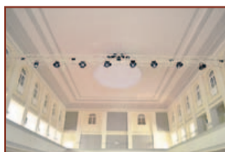
Georg-Wilhelm-Saal: Galerie und Lichttechnik.